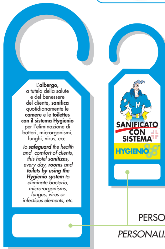
ETICHETTA PERSONALIZZATA PERSONALIZED LABELS