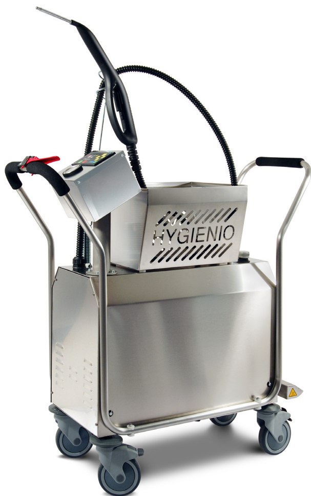
— SISTEMA HYGIENIO/HYGIENIO SYSTEM